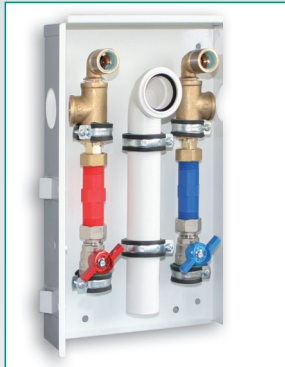
Sanitär Abwasser Messing ohne Zirkulation