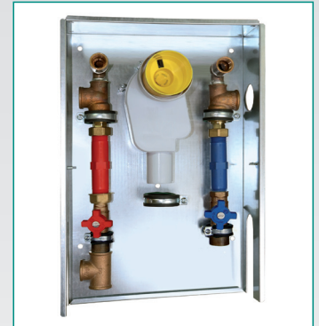
Sanitär Abwasser Rotguss mit Zirkulation