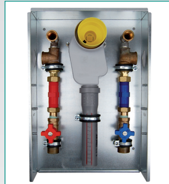
Sanitär Abwasser Rotguss ohne Zirkulation