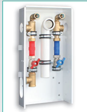
Sanitär Abwasser Messing mit Zirkulation