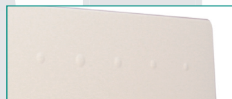
Revisionsabdeckung Typ KAM