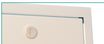
Revisionsabdeckung Typ RT