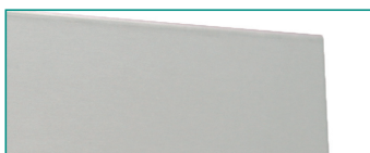
Revisionsabdeckung Typ AMM